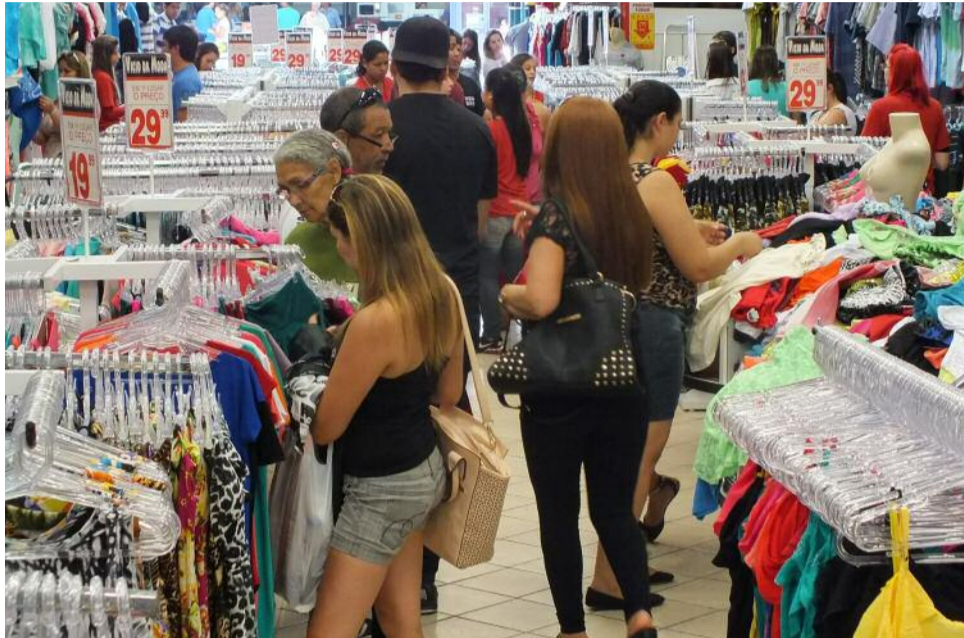
Município ganha posição de destaque em SC e no Brasil

O levantamento mostra que, em 2015, as cidades catarinenses perderam 7,22% do PIB (Produto Interno Bruto). Nesse cenário, considerando o PIB referente aos tributos municipais, São José se destacou. Entre as cidades com a maior arrecadação do estado, a única que cresceu foi São José, que obteve um desempenho 4,18% melhor do que o ano anterior. Pa-