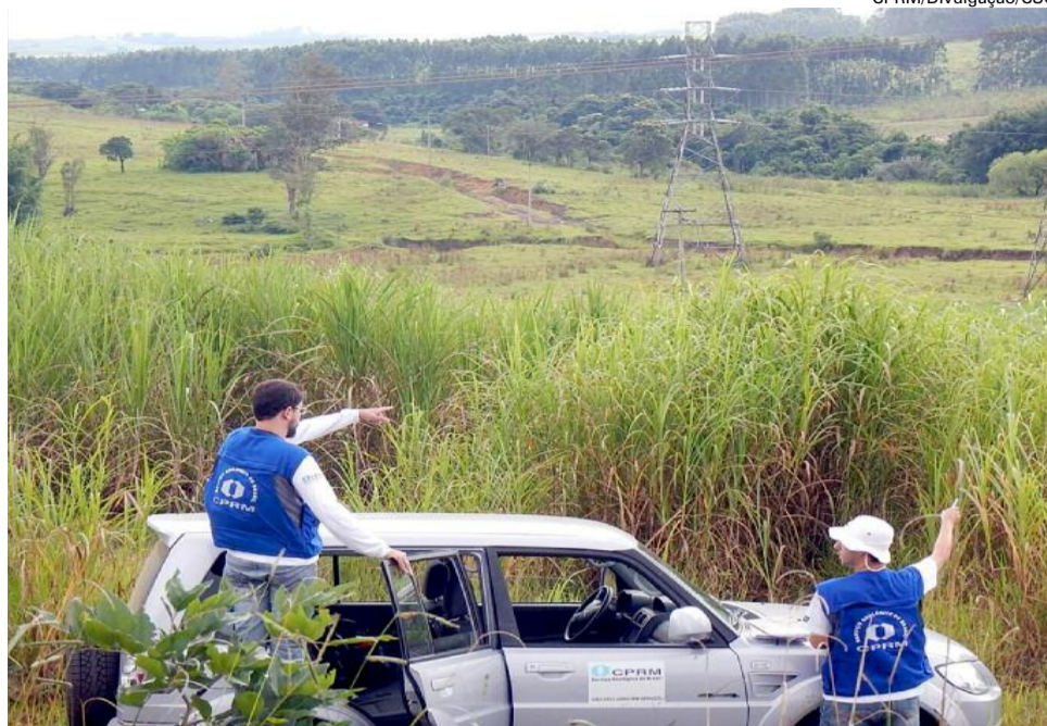
Pesquisadores durante avaliação iné dita de áreas de risco geológico no município Leoberto Leal

De acordo com a chefe da Divisão de Geologia Aplicada do Departa-