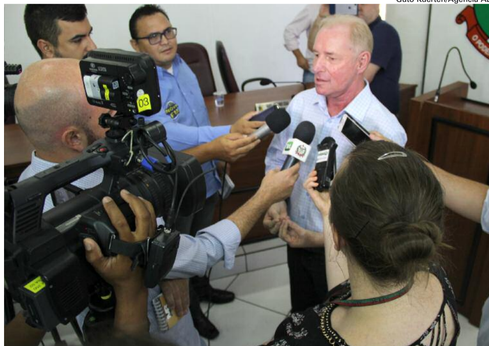
Deputado Aldo Schneider, durante coletiva em Rio do Sul; ele assume presidência da Alesc no dia 6, próxima terça-feira