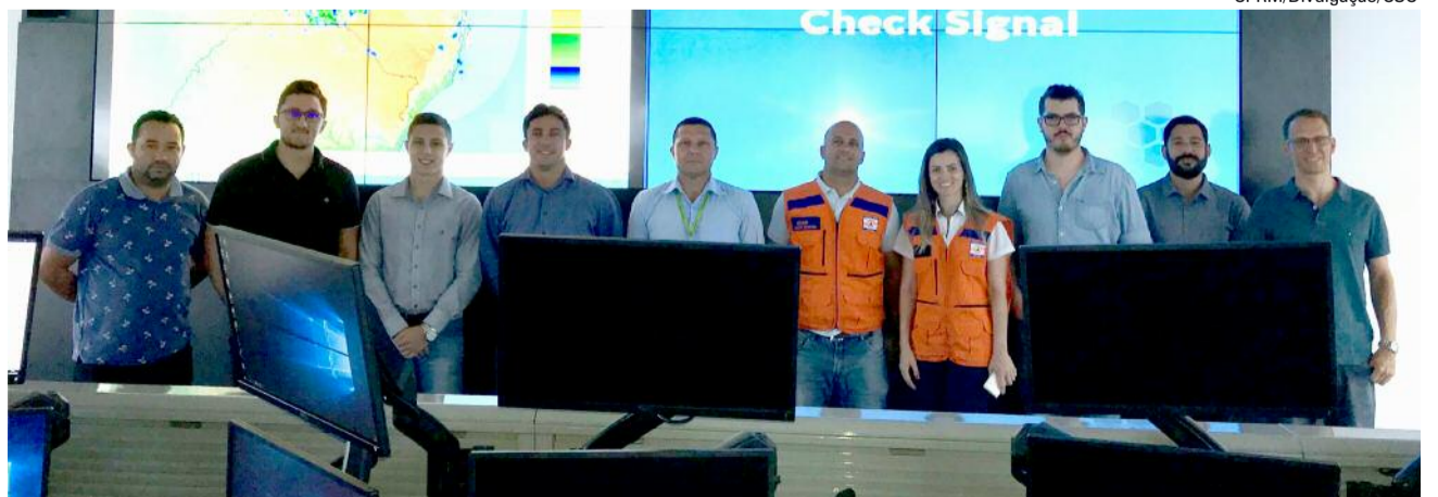
Equipe CPRM durante o Workshop sobre o Método GIDES com os representantes da Defesa Civil Estadual de Braço do Norte e Santo Amaro da Imperatriz.

Em 13 e 14 de março, será realizado, em Florianópolis, o 2º Seminário Internacional de Proteção e Defesa Civil, com foco na importância das políticas públicas na redução de riscos e desastres. Para 15 de março, o secretário Moratelli prevê a inauguração do Centro Integrado de Gerenciamento de Riscos e Desastres, também na Capital.