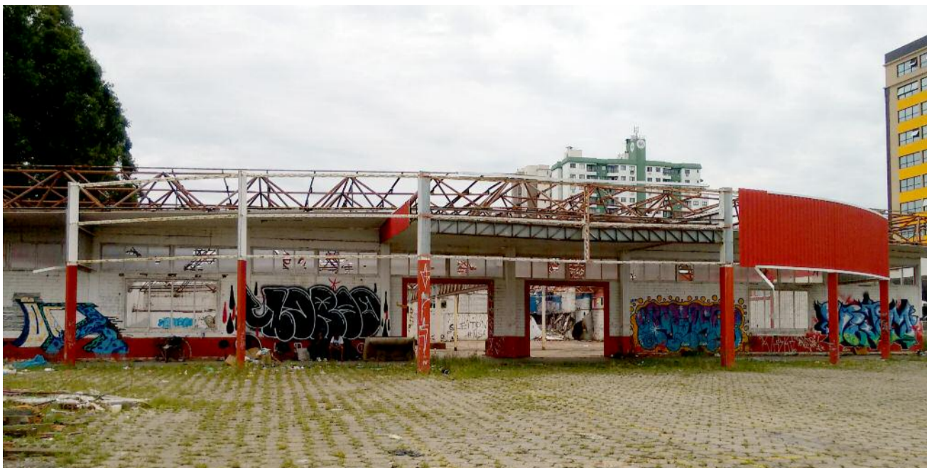
Local escolhido para nova unidade era um antigo mercado na rua Gerônimo Thives

O empresário. Que era filiado ao MDB e deixou o partido em janeiro passado, tem seu nome citado em conversas nos bastidores da política como possível candidato ao governo do Estado na eleição deste