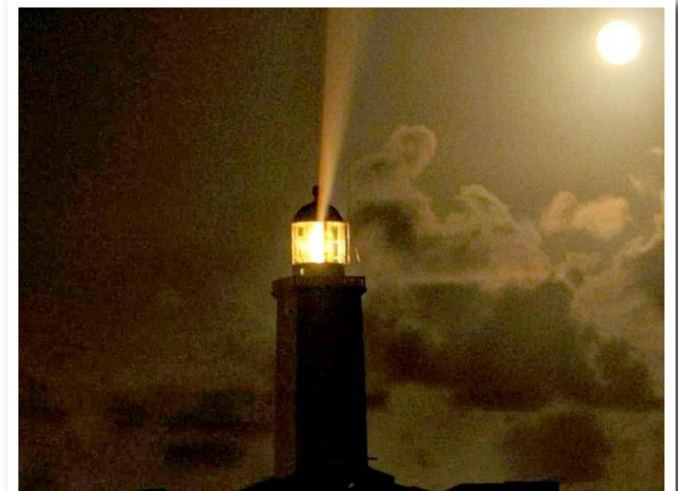
Luzes noturnas: O registro da Super Lua e o Farol de Santa Marta nesta quarta-feira (31/1), na Praia do Cardoso, em Laguna